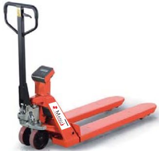
TRANSPALETTES PESEUR (AVEC IMPRIMENTE EN OPTION)