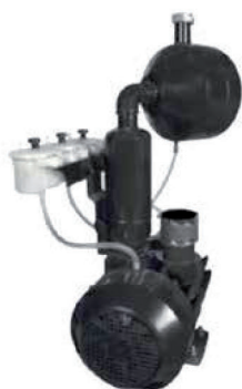
Pompe à vide

Pompe à vide, type d'huile, capacité 750 - 1000 - 1.200 tr / min Réservoir à vide 55 lt. / 65 lt. Moteur électrique 1,55 kW 3 hP 220V / 2,2 kW 4 hP 220V / 50hZ 10-12 Capacité de traite, 80 / 100 vaches / heure