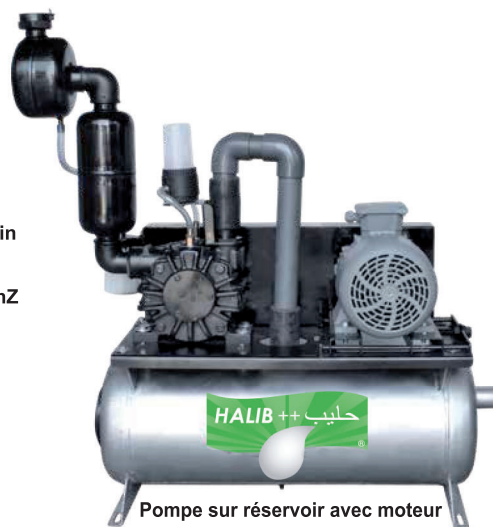
Pompe sur réservoir avec moteur

Pompe à vide, type d'huile, capacité 750 - 1000 - 1.200 tr / min Réservoir à vide 55 lt. / 65 lt. Moteur électrique 1,55 kW 3 hP 220V / 2,2 kW 4 hP 220V / 50hZ 10-12 Capacité de traite, 80 / 100 vaches / heure