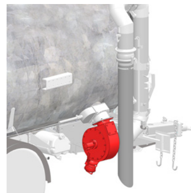
ACCÉLÉRATEUR DE REMPLISSAGE 8" SORTIE DE LA VANNE