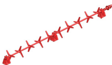
MÉLANGUER HYDRAULIQUE INTERNE