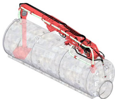
BRAS TOUREL 3 ARTICULATIONS AVEC KIT DE PURGE, CAISSON DE DRAINAGE ET SIPHON PRIMAIRE

Pour tout équipement, nous avons plusieurs options disponibles avec lesquelles vous pouvez équiper votre produit standard. Dans ce cas, nous mettons en évidence une large gamme de pompes de compresseur/dépresseur (STAR, PN et DL), de systèmes à canon pivotant (GARDA, JULIA et ITALA), de bras de chargement latéraux et supérieurs (tourelle), d'accélérateurs de chargement et de localisateurs Vogelsang ou Herculano.