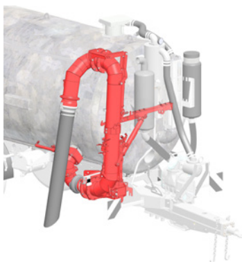
BRAS DE POMPAGE AVEC 2 ARTICULATIONS, TAILLE M, L ET XL