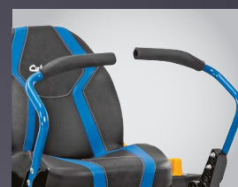
LEVIERS AVEC GRIP SOFT TOUCH ANTI-VIBRATION