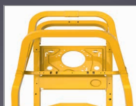
CHÂSSIS TUBULAIRE 50X50 MM