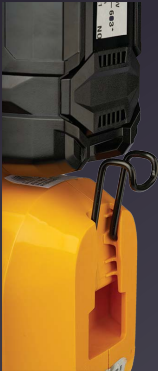
CROCHET ESCAMOTABLE INTÉGRÉ