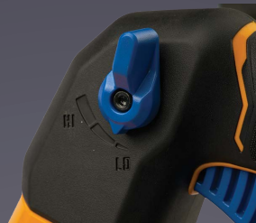
RÉGULATEUR DE VITESSE