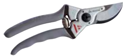
► SÉCATEUR PROLINE MANCHES ALUMINIUM POUR FRUITIERS 3604

Spécial grosses branches. Très résistant et ergonomique.