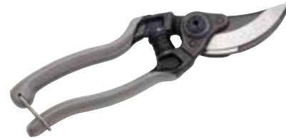
► SÉCATEUR PROLINE FORGÉ 3504

Manches en aluminium avec recouvrement antidérapant: ergonomique et léger.