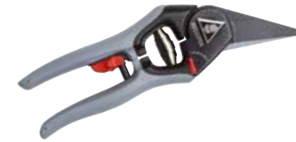
► SÉCATEUR COUPE DÉLICATE 3401