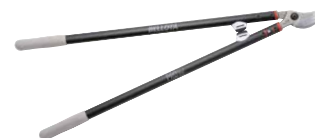
► SÉCATEUR À DEUX MAINS PROLINE FRUITIERS 3580

Pour l'élagage universel: raisin, fruits et olive. Manches extensibles 60 jusqu'à 90 cm.