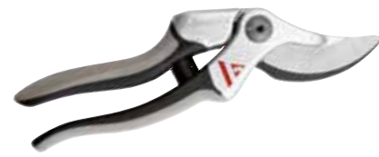
► SÉCATEUR EASYCUT PROLINE MANCHES ALUMINIUM 3512