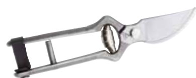
► SÉCATEUR FORGÉ 23501