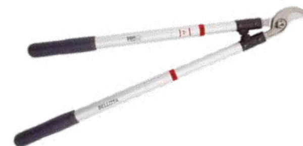
► SÉCATEUR PROLINE TÉLESCOPIQUE 3578

Pour l'élagage universel: raisin, fruits et olive.