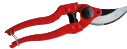
► SÉCATEUR PROLINE 3505