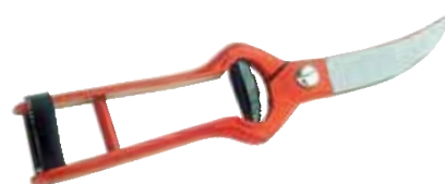
► SÉCATEUR POUR L'AIL FORGÉ 3503