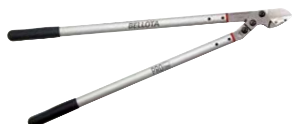
► SÉCATEUR PROLINE À ENCLUME FRUITIERS 3581

Pour l'élagage des fruitiers. Pour la coupe de gros diamètres