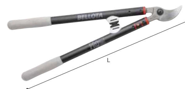
► SÉCATEUR À DEUX MAINS PROLINE 3578