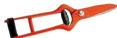
► SÉCATEUR POUR VENDANGE FORGÉ 3502