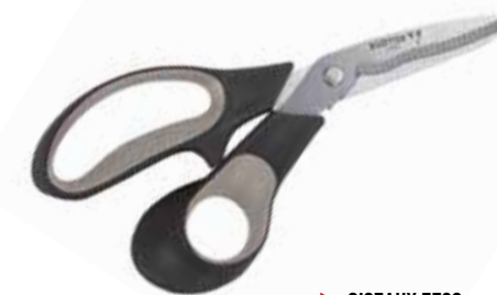
► CISEAUX 3520

Pour l'entretien. Pour un travail rapide et confortable, coupe extra-facile.