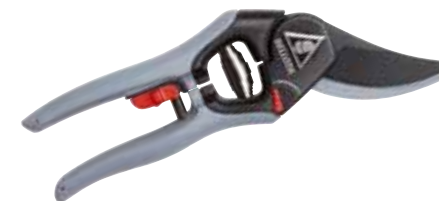
► SÉCATEUR 3403

Pour l'élagage des branches sèches et dures.