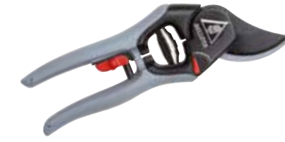
► SÉCATEUR EASYCUT 3404