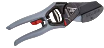
► SÉCATEUR À ENCLUME 3402

Pour la coupe délicate, nettoyage des feuilles, élagage des bonsaïs et travaux en détail.