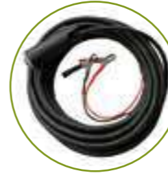
CABLE DE ALIMENTACIÓN 10 MT CON PINZAS Y CONECTOR CÂBLE D'ALIMENTATION 10 MT AVEC PINCES ET CONNECTEUR