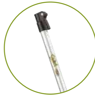
EXTENSIÓN TELESCÓPICA 1,5 MT RALLONGE TÉLESCOPIQUE 1,5 MT