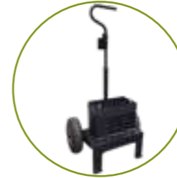
CARRETILLA PORTA BATERÍA CHARIOT PORTE-BATTERIE