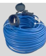
Rallonge 50 m Réf. : 6011-X1-0450