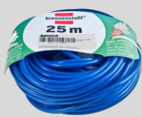
Rallonge 25 m Réf. : 6011-X1-0449