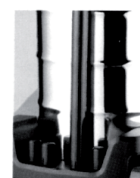
Support Porte Outils