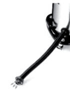
Dispositif De Vidange