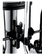
Support Porte Outils