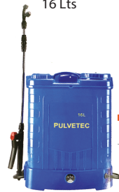
Pulvérisateur à batterie 16L - 12 v